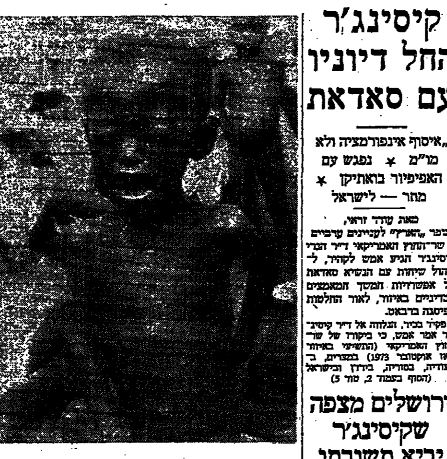
התצלום זה הופץ אצלם בין בדי ועידת המון הבין-לאומית ברומא, והוא מראה ליד מבעלת-הדבר, תוכנית מסיחית רב